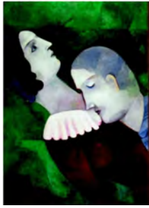
Les Amoureux en vert