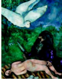
Abraham prêt à immoler son fils

deux religions du Livre. C'est à partir de l'exil new-yorkais que le motif de la crucifixion se développe comme symbole de la souffrance universelle des hommes. Il est souvent associé aux désastres de la seconde guerre mondiale et aux persécutions des juifs. Chagall promeut ainsi les valeurs du syncrétisme religieux. Reconnu pour la dimension spirituelle de son œuvre, l'artiste reçoit de nombreuses commandes pour la décoration de synagogues, de temples et d'églises.