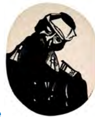
Le Soldat blessé

Chagall témoigne aussi de la vie quotidienne de sa communauté. « Je peignais tout ce qui me tombait sous les yeux. » peut-on lire toujours dans Ma Vie . Des personnages que l'on peut identifier comme Juifs apparaissent dans les œuvres de Chagall. Les mendiants de Vitebsk servent de modèles à bon nombre de portraits de rabbins.