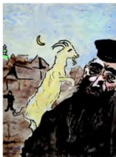
Le Juif et la Chèvre

Chagall témoigne aussi de la vie quotidienne de sa communauté. « Je peignais tout ce qui me tombait sous les yeux. » peut-on lire toujours dans Ma Vie . Des personnages que l'on peut identifier comme Juifs apparaissent dans les œuvres de Chagall. Les mendiants de Vitebsk servent de modèles à bon nombre de portraits de rabbins.