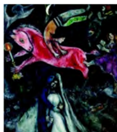
Le Cheval rouge

Chagall tire de son enfance cet intérêt pour la figure animale. Il grandit dans une cour de ferme entre un grand-père boucher et un père employé dans un dépôt de harengs. Il peut dire ainsi « je me suis servi des vaches, des filles de ferme, de coqs et de l'architecture de la province russe parce qu'ils font partie de l'environnement dans lequel j'ai grandi ». De même, la figure de la chèvre est récurrente dans ses souvenirs puisque l'animal accompagnait souvent les troupes itinérantes de saltimbanques et musiciens lors des fêtes importantes de la communauté juive de Vitebsk.