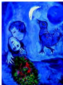
Le Paysage bleu

C'est tout d'abord par l'usage de couleurs inattendues que la magie opère : le cheval est rouge, la chèvre est jaune, l'oiseau bleu... Plus marquant encore, l'artiste combine au gré de sa fantaisie les différentes espèces entre elles : naissent ainsi un poisson-volant, un âne-lapin ou encore une chèvre ailée. Les animaux ont des postures voire des regards humains ou même se trouvent affublés de main, de pied ou de visage. Dans ce jeu de combinaisons, la frontière entre le monde des hommes et des animaux devient floue.