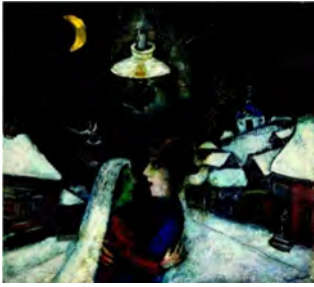
Dans la nuit

Chagall est un artiste qui privilégie la narration dans ses peintures sans respecter le déroulement chronologique des événements. Ces œuvres juxtaposent ainsi plusieurs niveaux de temps : souvenirs de sa jeunesse, épisodes de sa vie présente, actualité... L'horloge ailée est un motif récurrent chez Chagall comme détail dans L'Exode ou comme protagoniste dans Le temps n'a pas de rive . Cette image donne corps au rapport de Chagall au temps. C'est aussi un souvenir de la belle horloge que possédaient les parents de Chagall.