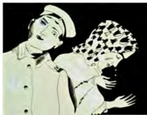
Couple de paysans, départ pour la guerre

En 1914, Chagall est en Russie, piégé par la déclaration de guerre. Il assiste depuis son village de Vitebsk aux déplacements des populations, aux départs des soldats à la guerre, au transport des blessés. Dans son travail, l'artiste témoigne des ravages de la guerre. Il nous livre une chronique réaliste de ses observations à travers une série de dessins noirs et blancs, des œuvres qui constituent un étonnant théâtre d'ombres.