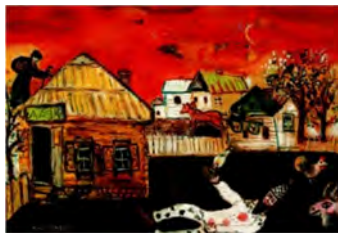
Scène de village à Vitebsk

Cette évocation constante de la tradition juive n'est pas sans mélancolie ni inquiétude. En effet, Chagall souhaite rendre compte des forces qui menacent la communauté de l'intérieur (difficulté de transmettre les coutumes d'une génération à l'autre) et de l'extérieur (antisémitisme, pogroms, Shoa). Rien n'évoque mieux ces menaces que la figure du Juif errant, vieillard courbé sous le poids de son baluchon, très souvent représenté dans l'œuvre de Chagall. On le rencontre ainsi, flottant dans les airs, dans Scène de village à Vitebsk ou dans Au-dessus de Vitebsk .