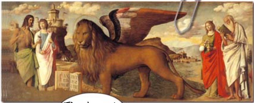
“Le lion de saint Marc”