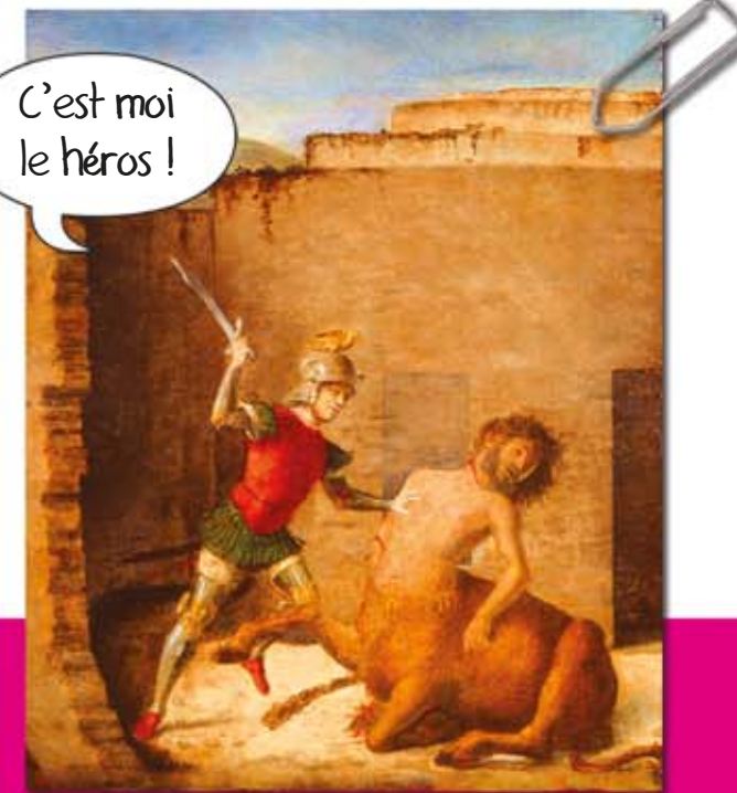
Duel entre Thésée et le Minotaure

Tiens, ici, il n'y a pas de paysage derrière les personnages, mais un mur ! On devine une porte. C'est sans doute l'entrée du labyrinthe que doit emprunter Thésée. C'est là que l'attend le redoutable minotaure... Qui d'après toi va gagner le combat ? Le héros bien sûr !