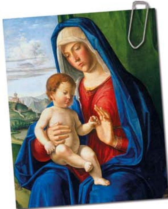
Vierge à l'enfant