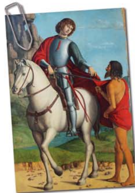
Saint Martin et le mendiant

😊 Cherche l'intrus en regardant le vrai tableau de "Saint Martin et le mendiant"