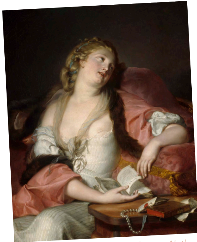
Jeune femme lisant les lettres d'Héloïse et Abélard

La société du XVIIIe a cherché à limiter la lecture des femmes, susceptible d'exacerber leur « sensibilité ». Les artistes se sont emparés de ce sujet et ont pris beaucoup de plaisir à représenter la femme s'adonnant à cet exercice interdit, porteur de jouissance. La lecture féminine a même pu être assimilée à la pratique de l'onanisme, naturellement sévèrement condamnée par les doctrines à la fois religieuses et médicales de l'époque. Fragonard représente une femme alanguie, dans sa jouissance solitaire, dont le livre est le support principal. Il faut ainsi relever la force subversive de l'image qui « brave alors les interdits intellectuels et sexuels faits aux femmes ». L'œuvre n'en reste pas moins destinée à un public masculin jouissant à leur tour de la représentation de cette femme, pâmée dont la gorge est largement dévoilée.